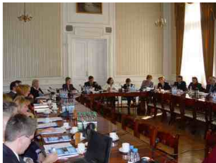
Posiedzenie Małopolskiego Komitetu Monitorującego - 9 listopada 2005 r.

W listopadzie odbędzie się cykl szkoleń organizowanych przez Biuro Zarządzania Funduszami Europejskimi MUW dla beneficjentów ZPORR. Szkolenia będą skierowane do beneficjentów z działań: 1.5., 1.6., 3.5.1., 3.5.2., którzy podpiszą umowy w najbliższym czasie. Zostaną na nich omówienie