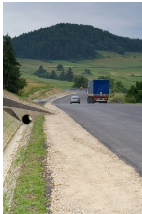
Droga wojewódzka nr 969, po zakończeniu inwestycji

Realizacja projektu była istotna zarówno dla Zarządu Dróg Wojewódzkich - jako zarządcy drogi jak i dla mieszkańców, lokalnych