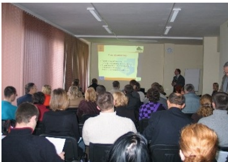
Spotkanie Informacyjne z potencjalnymi beneficjentami Działania 2.1 ZPORR, 5 grudnia 2005 r.

W dniu 15 grudnia 2005 r. w Restauracji „Pod Gruszką” odbyła się Konferencja Regionalna na temat wykorzystania środków Zintegrowanego Programu Operacyjnego w Działaniach wdrażanych przez Wojewódzki Urząd Pracy. W konferencji uczestniczyli beneficjenci którzy realizują projekty w ramach Działania 2.1 oraz beneficjenci którzy podpisali umowy na realizację projektów w ramach Działania 2.3. W spotkaniu uczestniczyło 40 osób.