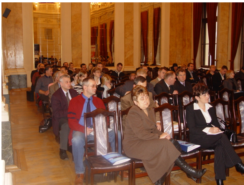
Konferencja "Wdrażanie Zintegrowanego Programu Operacyjnego Rozwoju Regionalnego 2004-2005 - doświadczenia i perspektywy", Kraków, 16 grudnia 2005 r.