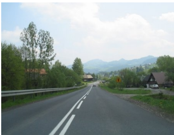
Droga wojewódzka nr 969, km 22+700, przed rozpoczęciem inwestycji

Inwestycja ta pozwoli na pełniejsze wykorzystanie walorów turystycznych terenu, zwiększenie liczby osób korzystających z różnych form wypoczynku, rozwój sektora usług związanego z obsługą ruchu turystycznego, ułatwi dostęp mieszkańców do ośrodków centralnych (Nowy Targ, Nowy i Stary Sącz) oraz rozwiąże problem z utrzymaniem przejezdności drogi w okresie zimowym.