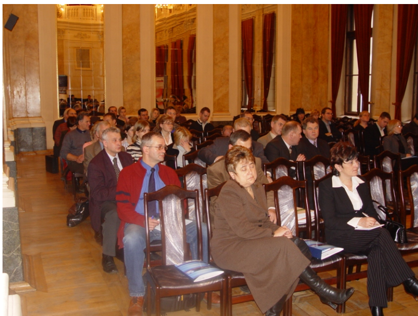
Konferencja "Wdrażanie Zintegrowanego Programu Operacyjnego Rozwoju Regionalnego 2004-2005 - doświadczenia i perspektywy", Kraków, 16 grudnia 2005 r.