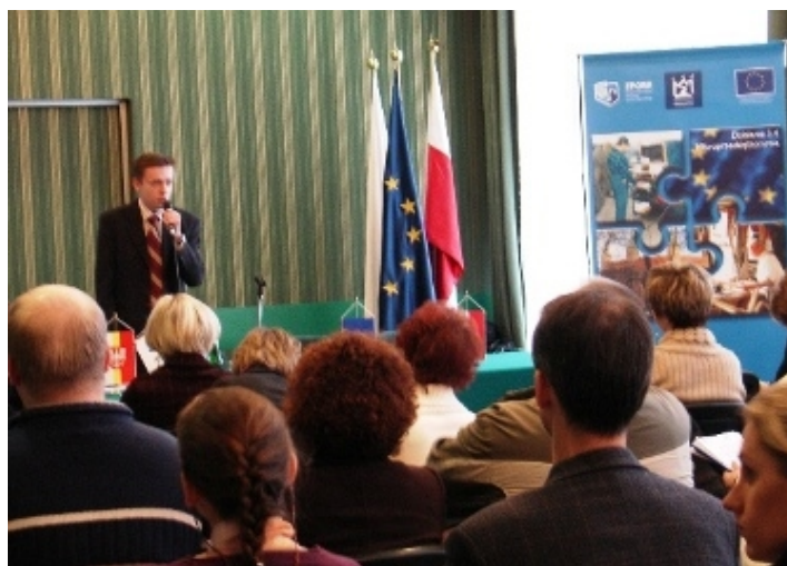
Szkolenie dla rzeczywistych beneficjentów Działania 3.4 (nr Dz. 3.4/ML/2/05), z którymi zostały podpisane umowy, Kraków, 03.02.2006 r.

Przez cały styczeń 2006 r. trwała ocena formalna 102 wniosków o dofinansowanie złożonych w grudniu w konkursie nr Dz. 3.4/ML/3/05.