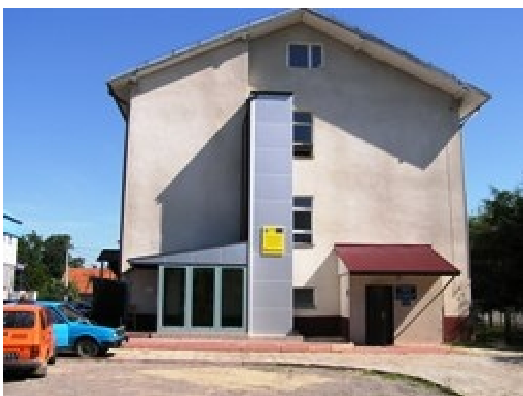
Gminny Ośrodek Zdrowia w Szczucinie

Widocznym i docenianym przez ogół ludności efektem jest podniesienie jakości pracy Ośrodka Zdrowia poprzez zwiększenie dostępności zasobów medyczno-rehabilitacyjnych placówki dla wszystkich pacjentów.