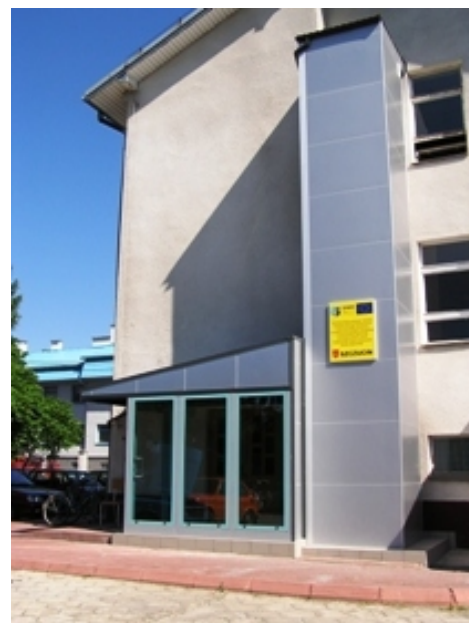
Gminny Ośrodek Zdrowia w Szczucinie

W efekcie wykonanych działań, budynek Gminnego Zakładu Opieki Zdrowotnej w Szczucinie stał się dostępny dla niepełnosprawnych korzystających ze świadczeń