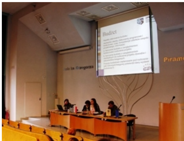
Konferencja informacyjna "Praktyczne wskazówki dla beneficjentów (ostatecznych odbiorców) do konkursu nr Dz.2.5/ML/1/06", 15.03.2006 r., Kraków

Dodatkowo 30 marca br. w Hotelu Campanile w Krakowie, zorganizowano szkolenie dla rzeczywistych beneficjentów Działania 3.4 ZPORR, wyłonionych w ramach konkursu nr Dz.3.4/ML/3/05. Szkolenie dotyczyło realizacji projektu dofinansowanego ze środków Europejskiego Funduszu Rozwoju Regionalnego oraz budżetu państwa. W trakcie szkolenia, w którym udział wzięło 77 osób, omówione zostały kwestie związane m.in. z wnioskami płatniczymi, monitoringiem oraz sprawozdawczością. Istotnym elementem szkolenia było podpisanie z beneficjentami umów o dofinansowanie. Materiały z konferencji są dostępne na stronie internetowej http://zporr.wrotamalopolski.pl w dziale Konferencje i szkolenia =>Materiały z konferencji .