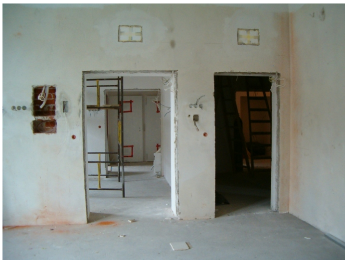
W trakcie remontu zespołów operacyjnych

Dokonano już także większości zakupów sprzętu i aparatury medycznej. Przewidziano całkowicie nowe i nowoczesne wyposażenie bloków operacyjnych, a w tym zakresie przede wszystkim stoły operacyjne, kolumny chirurgiczne i anestezyjologiczne, aparaty do znieczulenia i respiratory, kardiomonitory i defibrylatory, a także