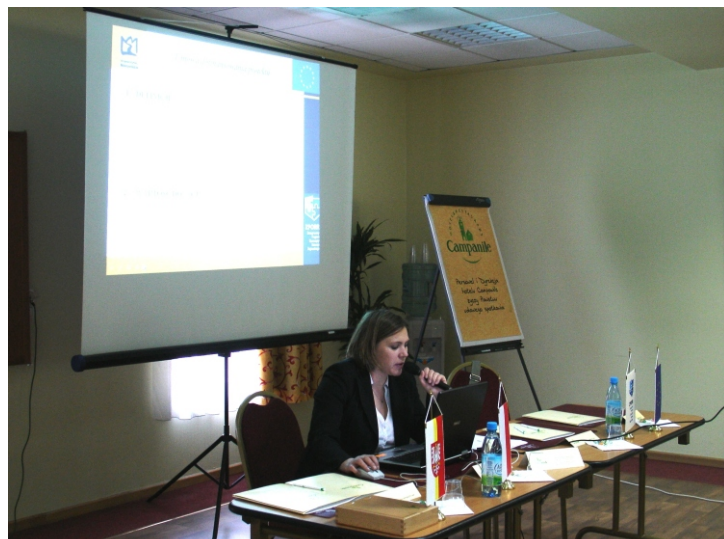
Szkolenie dla rzeczywistych beneficjentów Działania 3.4 ZPORR, wyłonionych w ramach konkursu nr Dz.3.4/ML/3/05, 30.03.2006 r., Kraków.