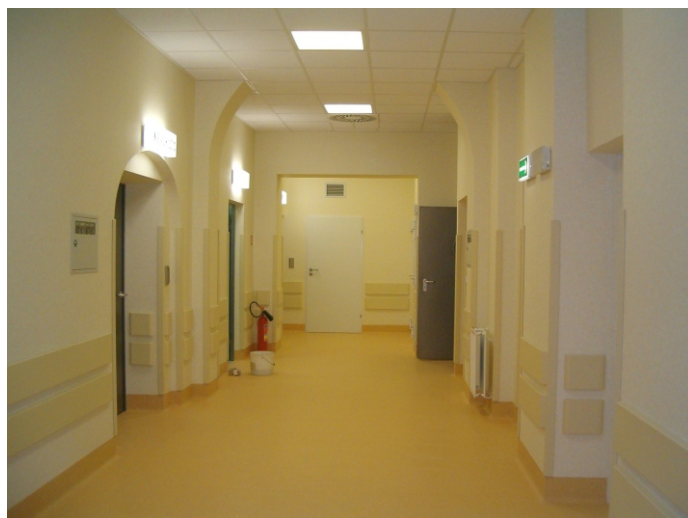
Po remoncie zespołów operacyjnych