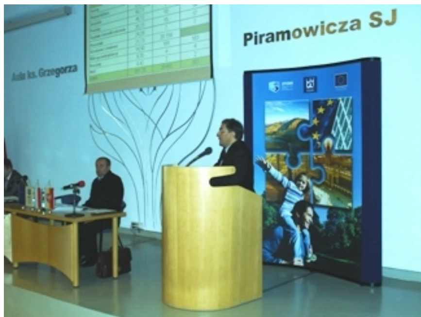
Konferencja pt. „Stan realizacji Zintegrowanego Programu Operacyjnego Rozwoju Regionalnego 2004 2006 (ZPORR) w Małopolsce”, Kraków, 30.05.2006 r.

Program konferencji oraz formularz zgłoszeniowy są dostępne na stronie internetowej