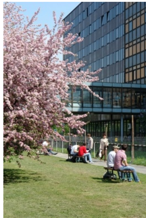
Ściana zewnętrzna budynku Politechniki Krakowskiej po modernizacji

1. Poprawa jakości kształcenia oraz zwiększenie dostępu do wiedzy poprzez utrzymanie obecnej bazy laboratoryjnej i możliwość jej rozwoju. 2. Utrzymanie liczby studentów na obecnym poziomie poprzez umożliwienie dalszego użytkowania głównego budynku Wydziału Mechanicznego PK.