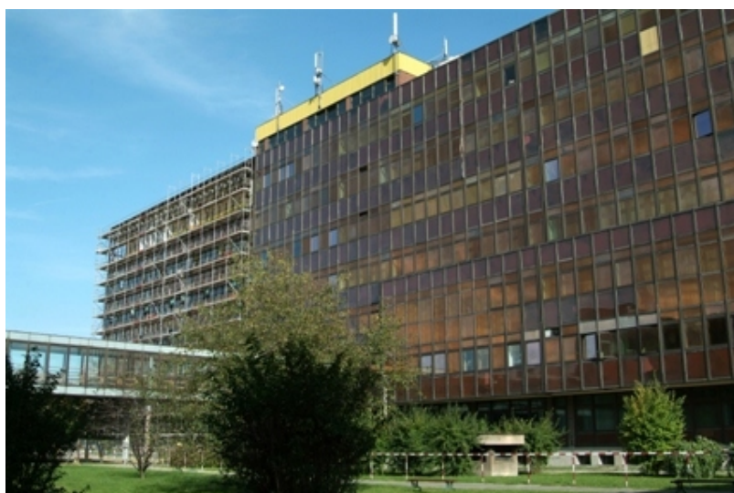
Budynek Politechniki Krakowskiej przed modernizacją