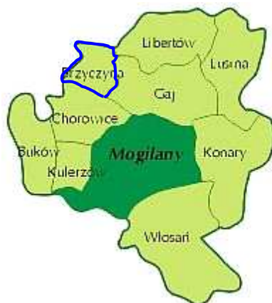
Rysunek 2 – Podział Gminy Mogilany na sołectwa.

Powierzchnia całej Gminy Mogilany wynosi 4371.3560 ha, natomiast powierzchnia miejscowości Brzyczyna wynosi 143.8536 ha, co stanowi 3,29% ogólnej powierzchni Gminy.