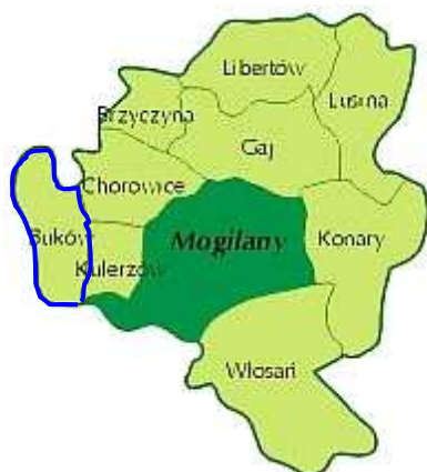
Rysunek 2 – Podział Gminy Mogilany na sołectwa.

Powierzchnia całej Gminy Mogilany wynosi 4371.3560 ha, natomiast powierzchnia miejscowości Buków wynosi 308.5311 ha, co stanowi 7,06% ogólnej powierzchni Gminy.