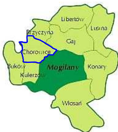
Rysunek 2 – Podział Gminy Mogilany na sołectwa.

Powierzchnia całej Gminy Mogilany wynosi 4371.3560 ha, natomiast powierzchnia miejscowości Chorowice wynosi 318.0832 ha, co stanowi 7,28% ogólnej powierzchni Gminy.