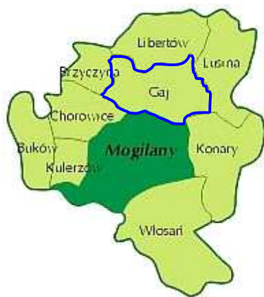
Rysunek 2 – Podział Gminy Mogilany na sołectwa.

Powierzchnia całej Gminy Mogilany wynosi 4371.3560 ha, natomiast powierzchnia miejscowości Gaj wynosi 500.7186 ha, co stanowi 11,45% ogólnej powierzchni Gminy.