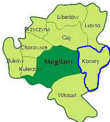
Rysunek 2 – Podział Gminy Mogilany na sołectwa.

Powierzchnia całej Gminy Mogilany wynosi 4371.3560 ha, natomiast powierzchnia miejscowości Konary wynosi 542.6309 ha, co stanowi 12,41% ogólnej powierzchni Gminy.