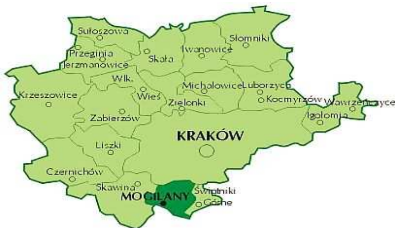
Rysunek 1 – Położenie Gminy Mogilany na tle powiatu krakowskiego.

Prezentację Gminy Mogilany na tle powiatu krakowskiego przedstawia rysunek nr 1, natomiast szczegółową lokalizację sołectwa Kulerzów na tle Gminy Mogilany prezentuje rysunek nr 2.