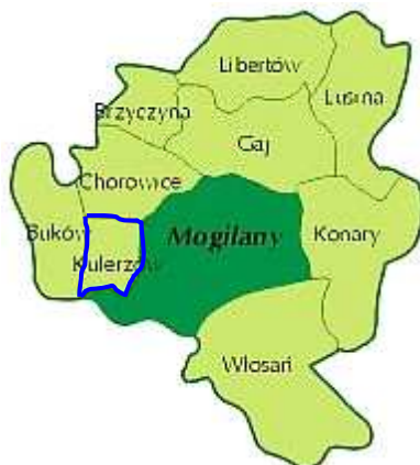
Rysunek 2 – Podział Gminy Mogilany na sołectwa.

Powierzchnia całej Gminy Mogilany wynosi 4371.3560 ha, natomiast powierzchnia miejscowości Kulerzów wynosi 151.4504 ha, co stanowi 3,46% ogólnej powierzchni Gminy.