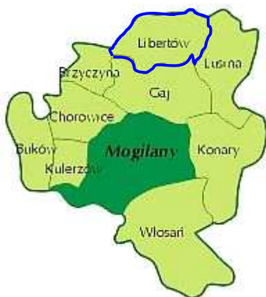
Rysunek 2 – Podział Gminy Mogilany na sołectwa.

Powierzchnia całej Gminy Mogilany wynosi 4371.3560 ha, natomiast powierzchnia miejscowości Libertów wynosi 377.1510 ha, co stanowi 8,63% ogólnej powierzchni Gminy.