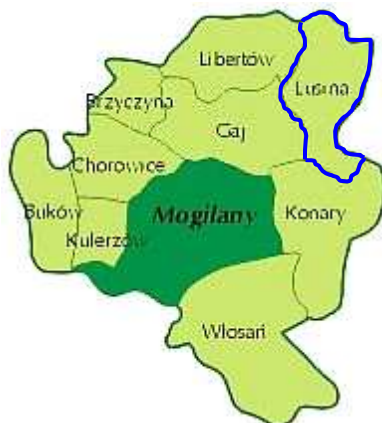
Rysunek 2 – Podział Gminy Mogilany na sołectwa.

Powierzchnia całej Gminy Mogilany wynosi 4371.3560 ha, natomiast powierzchnia miejscowości Lusina wynosi 405.0641 ha, co stanowi 9,27% ogólnej powierzchni Gminy.