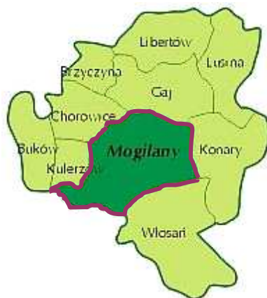
Rysunek 2 – Podział Gminy Mogilany na sołectwa.

Powierzchnia całej Gminy Mogilany wynosi 4371.3560 ha, natomiast powierzchnia miejscowości Mogilany wynosi 853.7771 ha, co stanowi 19,53% ogólnej powierzchni Gminy.