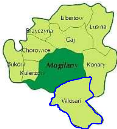
Rysunek 2 – Podział Gminy Mogilany na sołectwa.

Powierzchnia całej Gminy Mogilany wynosi 4371.3560 ha, natomiast powierzchnia miejscowości Włosań wynosi 770.0960 ha, co stanowi 17,62% ogólnej powierzchni Gminy.