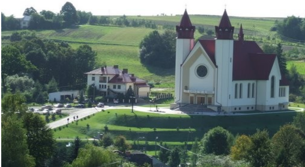
Zdjęcie: Sanktuarium MBP w Czeremnej

W roku 1996 udało się także wyremontować częściowo starą świątynię (zabytkowy kościół św Marcina) i ogrodzić parafialny cmentarz. Prace przy zabytkowym kościele trwają do dzisiaj. Obecnie odrestaurowano boczne ołtarze, obrazy, boczną ambonę, konstrukcję dachu i sam dach (pokryto gontem). Wzmocniono również i zabezpieczono fundamenty kościoła. Wyremontowano także ogrodzenie wokół kościoła z kapliczkami oraz dzwonnice. Trwają również prace remontowe przy schodach prowadzących do świątyni jak również prace przy wykładaniu obejścia wokół kościoła z kamienia naturalnego.