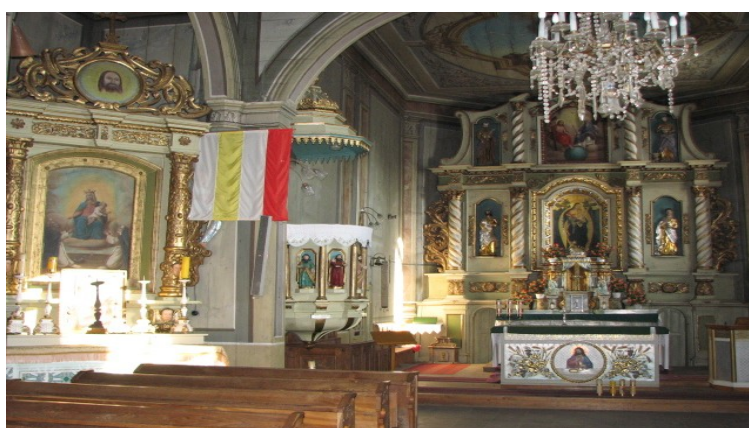
Zabytkowy kościół św Marcina w Czeremnej

W roku 1996 udało się także wyremontować częściowo starą świątynię (zabytkowy kościół św Marcina) i ogrodzić parafialny cmentarz. Prace przy zabytkowym kościele trwają do dzisiaj. Obecnie odrestaurowano boczne ołtarze, obrazy, boczną ambonę, konstrukcję dachu i sam dach (pokryto gontem). Wzmocniono również i zabezpieczono fundamenty kościoła. Wyremontowano także ogrodzenie wokół kościoła z kapliczkami oraz dzwonnice. Trwają również prace remontowe przy schodach prowadzących do świątyni jak również prace przy wykładaniu obejścia wokół kościoła z kamienia naturalnego.