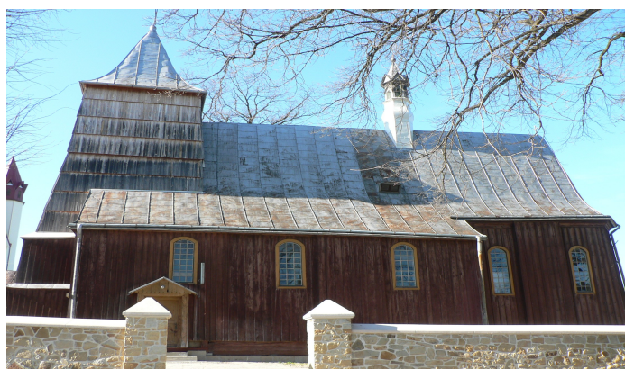
Zdjęcie: Kościół św. Marcina Biskupa w Czermnej (obecnie z dachem z gontu)

W skład zespołu kościelnego, położonego na lekkim wzniesieniu, wchodzi: 1. kościół drewniany; 2. dzwonnica murowana, parawanowa z XVIII/XIX w. 3. dawny cmentarz przykościelny (ob. plac przykościelny); 4. otaczające go kamienne ogrodzenie wraz z czterema kapliczkami i bramką; 5. rosnąca poza obwodem ogrodzenia pozostałość starodrzewu. Kościół jest w dobrym stanie technicznym i stanowi wraz z drzewostanem wyraźną dominantę w krajobrazie wsi. Należy objąć go szczególną ochroną konserwatorską. Obok tego kościoła wybudowany został nowy kościół. W niedalekiej odległości od kościołów położone są na wzniesieniach dwa cmentarze parafialne.