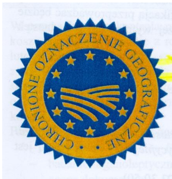
Wzór chronionego oznaczenia geograficznego