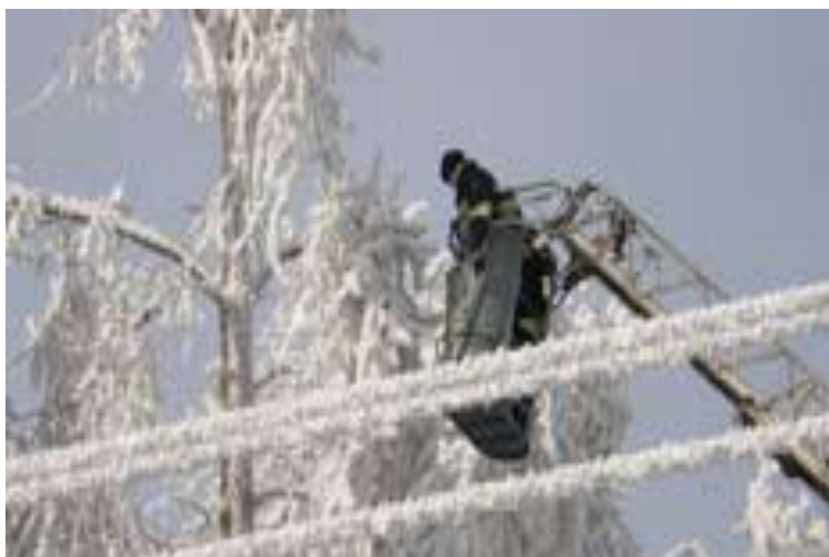
Szadź na drzewach zima 2010r.

Celem określenia dokładnych zintegrowanych prac pielęgnacyjno-konserwacyjnych parków po skutkach pogodowych zimy 2009/2010 (szadź wyłamała i uszkodziła wiele drzew), przeprowadzone zostały przez Wojewódzkiego Konserwatora Zabytków kontrole na terenie parku w Owczarach, parku dworskiego w Czernichowie oraz zespołu dworskiego w Sieborowicach.