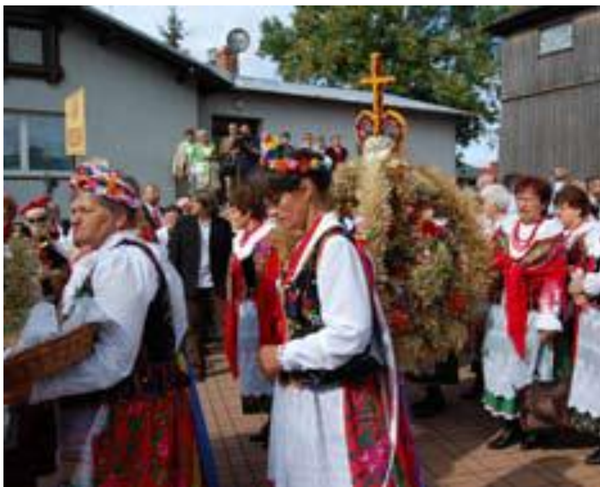
Dożynki w Liskach i Skale

Folklor ziemi krakowskiej w pełnej krasie pokazał Zespół Regionalny „Mogilanie” poprzez taniec, śpiew, stroje i muzykę podczas 25-lecia zespołu, które świętowano w Libertowie koncertem jubileuszowym. Zespół jest laureatem wielu nagród regionalnych jak i ogólnopolskich oraz międzynarodowych, dumą i najlepszą promocją gminy Mogilany i Powiatu.