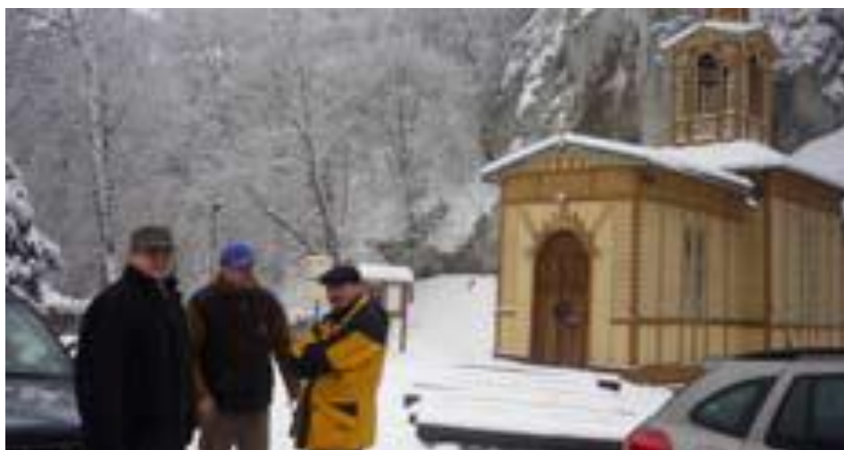
Szadź na drzewach zimą 2010r.