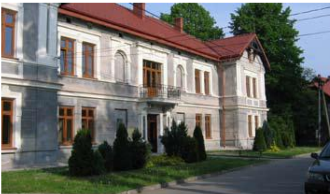
Dwór w Czernichowie –siedziba Zespołu Szkół Rolnicze Centrum Kształcenia Ustawicznego im. Franciszka Stefczyka w Czernichowie

W 2010 roku zlecono i wykonano remont bramy wjazdowej, budynku portierni oraz muru ogrodzeniowego wydatkując łącznie 67.770 zł z budżetu Powiatu.