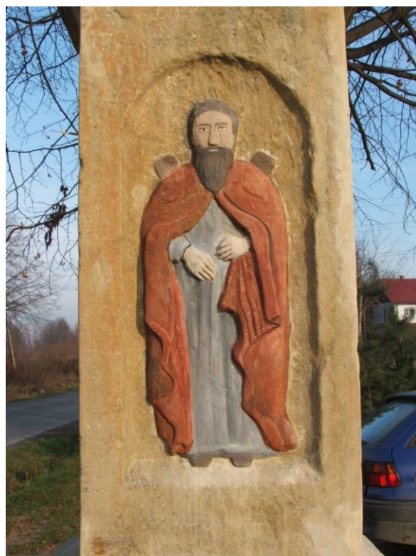
Kapliczka św. Floriana w Skawinie przed i po remoncie

Zaznaczyć trzeba, że w 2009 roku wydane zostały decyzje małopolskiego Wojewódzkiego Konserwatora Zabytków dotyczące wpisania 3 kapliczek z gminy Skawina do rejestru zabytków ruchomych, Są to: