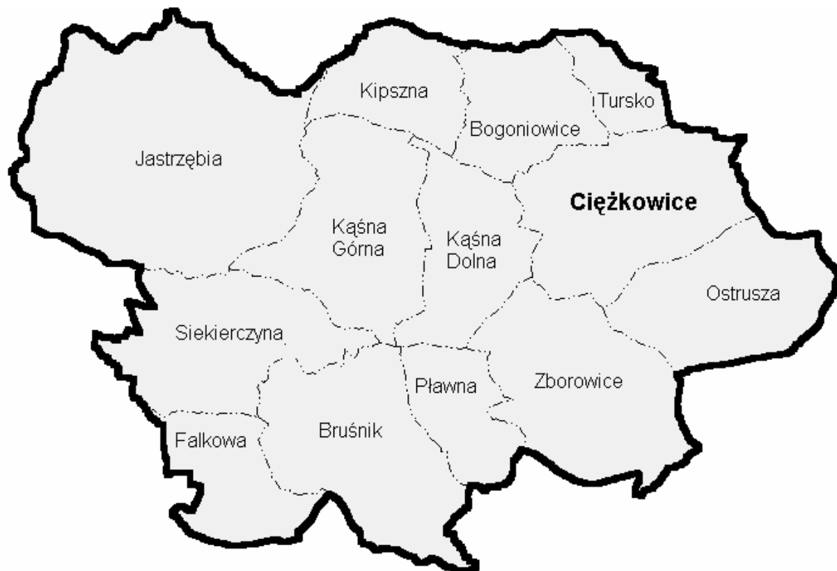
Mapa 2. Gmina Ciężkowice – podział administracyjny.