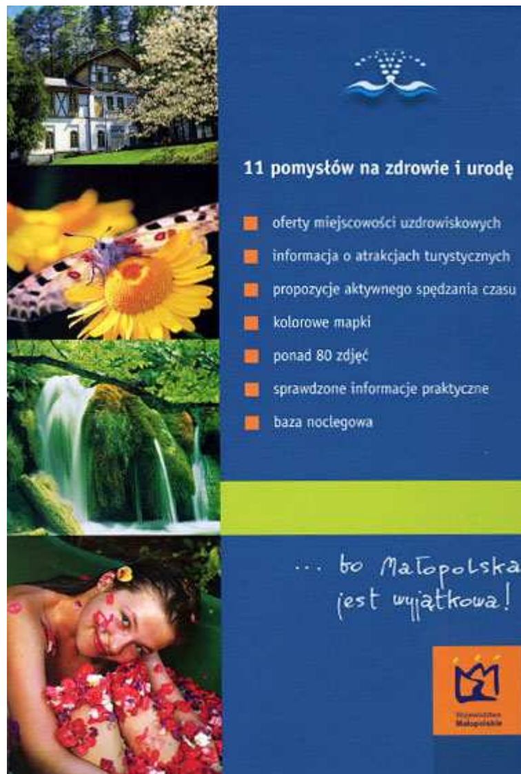
Okładka - tył